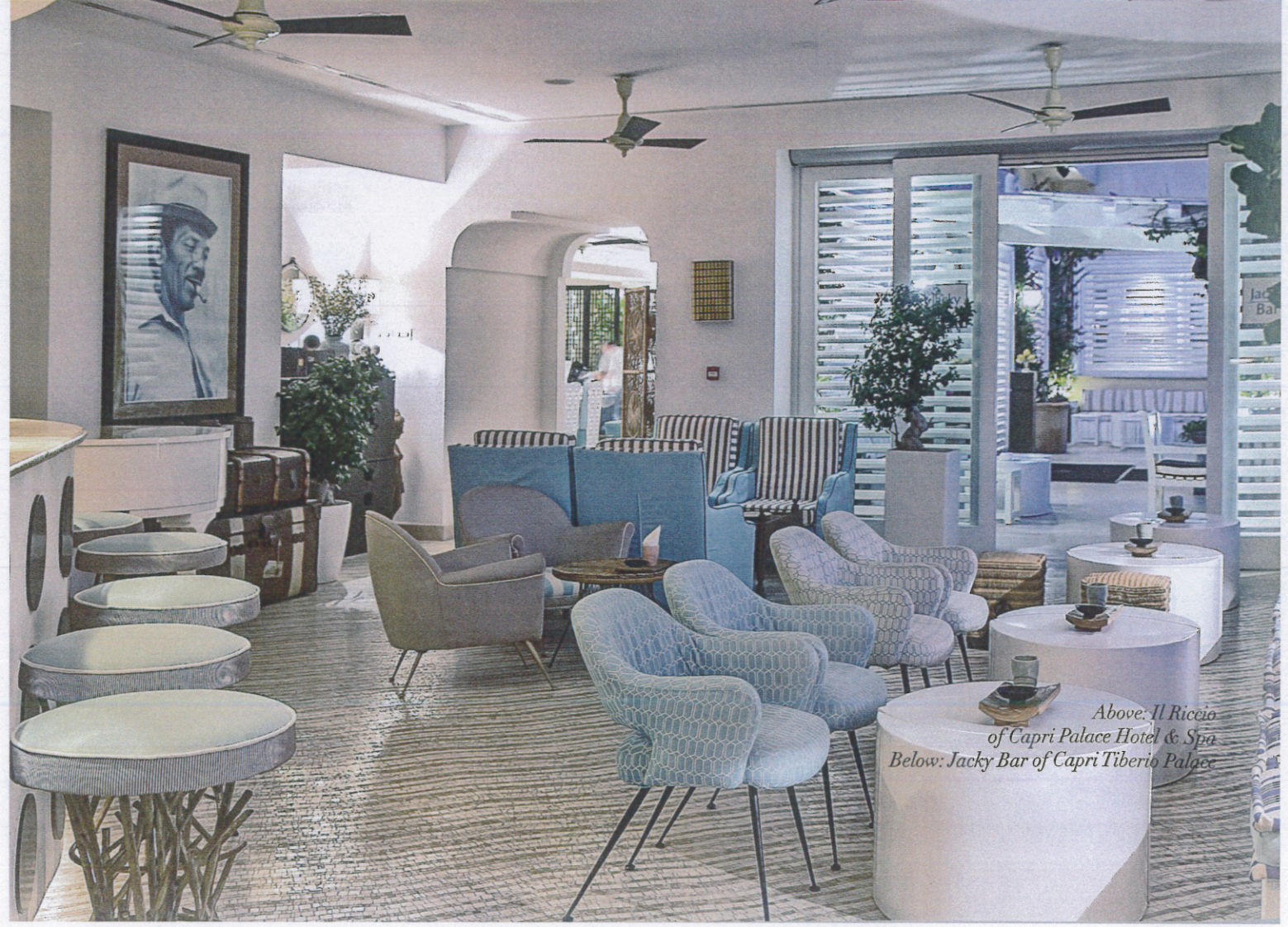
Above: Il Riccio of Capri Palace Hotel & Spa Below: Jacky Bar of Capri Tiberio Palace