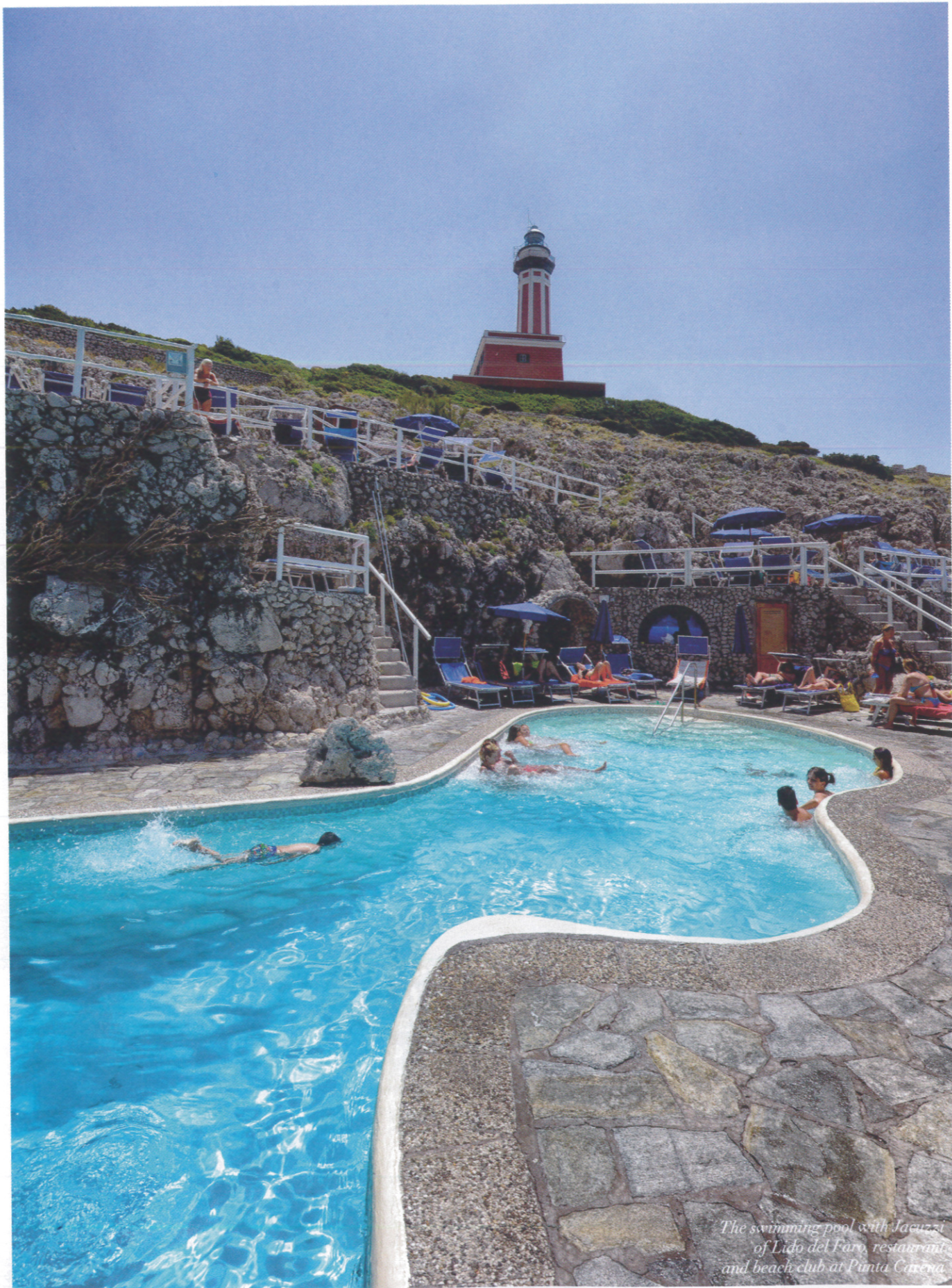
The swimming pool with Jacuzzi of Lido del Faro, restaurant and beach club at Punta Careva