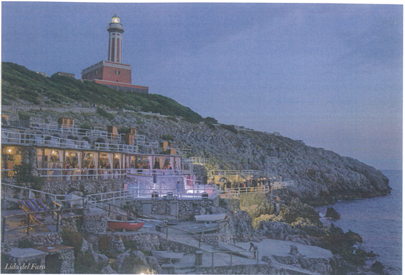
Lido del Faro

with contemporary design pieces. The result is an original and unique ambiance.