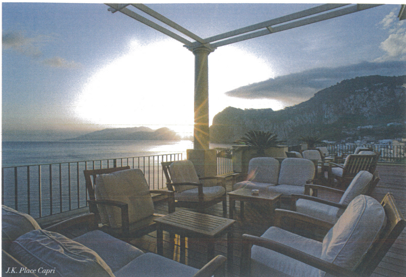
J.K. Place Capri

of Il Riccio and discovering a new dimension of the aperitivo caprese while being dazzled by the blue and the light of the sun that plunges into the sea?